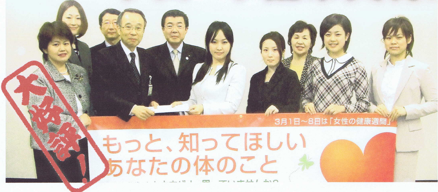
3月1日～8日は「女性の健康週間」